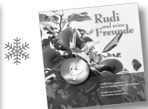
"Rudi und seine Freunde" Das Buch von KinderautorInnen für Freunde