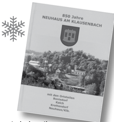
Gemeindechronik Alte Erinnerungen aufleben lassen

Bücher, die im Gemeindeamt erhältlich sind.