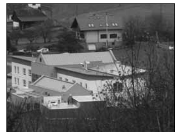
Das Altersheim steht kurz vor der Vollendung