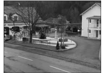
Der neue Hauptplatz von Neuhaus a. Klb.